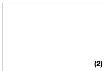
Čeona šina za pričvršćivanje