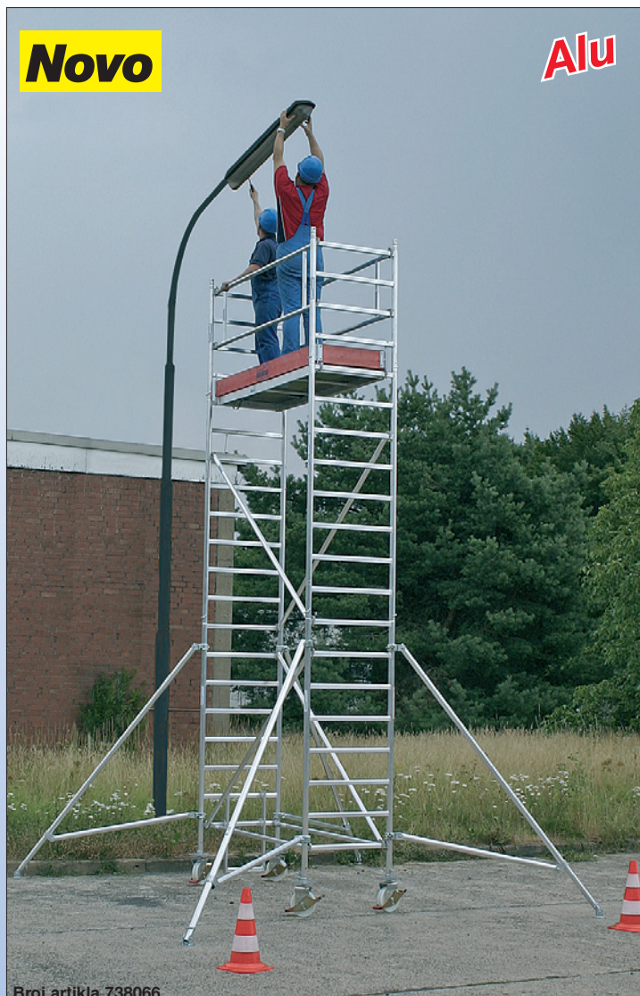
Broj artikla 738066

Važno upozorenje: U zavisnosti od montažnih varijacija obavezno je korišćenje balastnih tegova (dodatna oprema). Podaci o broju potrebnih balastnih tegova se nalaze u uputstvu za montažu i održavanje ili na internet sajtu proizvođača.