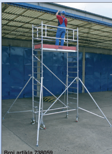
Broj artikla 738059