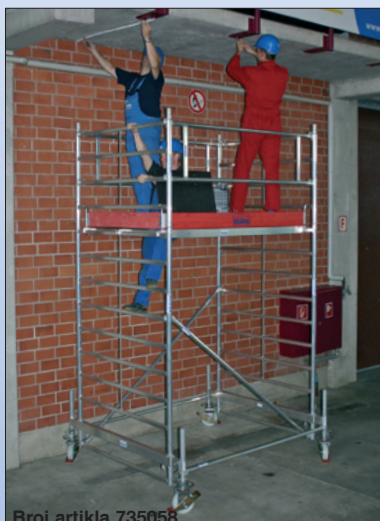
Broj artikla 735058