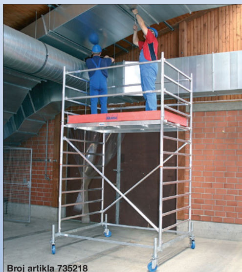
Broj artikla 735218