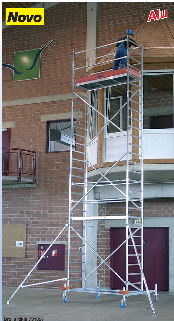
Broj artikla 731357

Važno upozorenje: U zavisnosti od montažnih varijacija obavezno je korišćenje balastnih tegova (dodatna oprema). Podaci o broju potrebnih balastnih tegova se nalaze u uputstvu za montažu i održavanje ili na internet sajtu proizvođača.