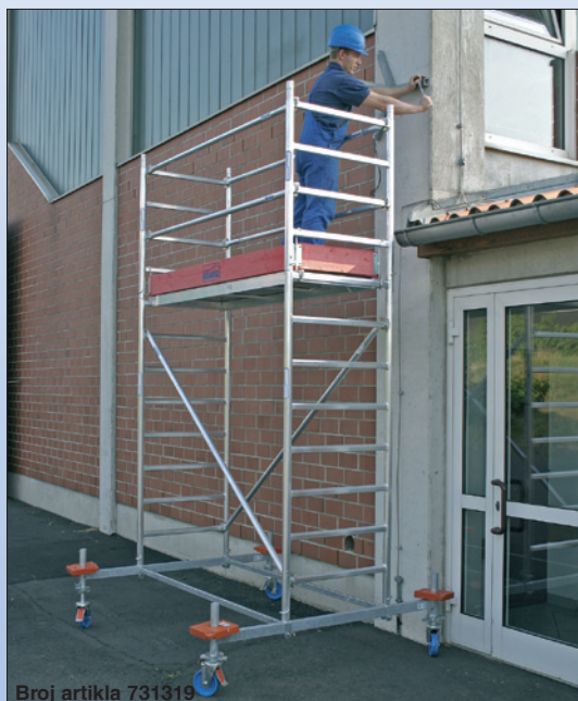
Broj artikla 731319