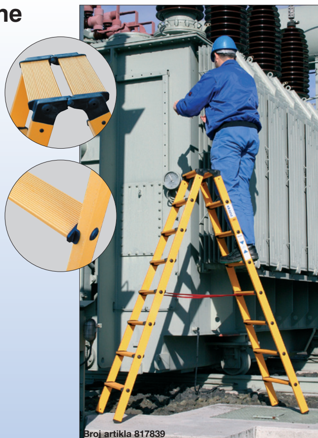
Broj artikla 817839