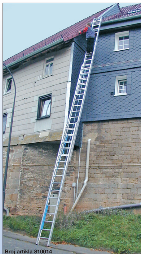
Broj artikla 810014