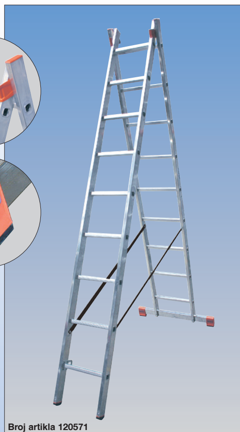
Broj artikla 120571